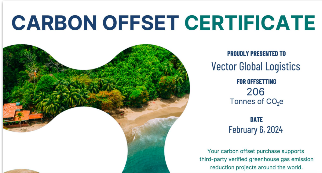
Ejemplo de certificado

Por cada envío en el que elijas compensar tu carbono, recibirás un certificado por correo electrónico.